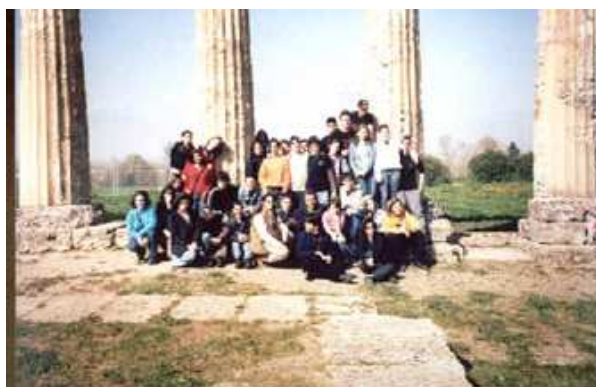
Οι μαθητές του 1 ου Ενιαίου Πειραματικού Λυκείου Αθηνών επισκέπτονται τους αρχαίους Λοκρούς

«Στο σταθμό της Εκκλησίας της Ελλάδας φιλοξενήθηκε για τέσσερις συνεχείς εκπομπές η περιγραφή του προγράμματος μας για τον πολιτισμό της Μεγάλης Ελλάδας. Έλληνες και Ιταλοί εκπαιδευτικοί και μαθητές είχαν την ευκαιρία να επικοινωνήσουν ζωντανά με το κοινό και να απαντήσουν στις ερωτήσεις που έθεσαν οι ακροατές.»