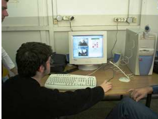
Υλοποίηση συνεδρίας τηλεδιάσκεψης των μαθητών στα πλαίσια του προγράμματος