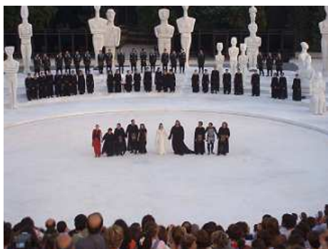
Εκδήλωση Αρχαίου Ελληνικού Θεάτρου στις Συρακούσες, Κ. Ιταλία

1ο Εν. Πειραματικό Λύκειο Αθηνών, Ελλάδα - Francesco La Cava, Bovalino, Ιταλία.