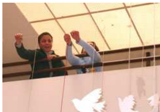
Δραστηριότητες των παιδιών κατά τον μήνα με θέμα την Ειρήνη