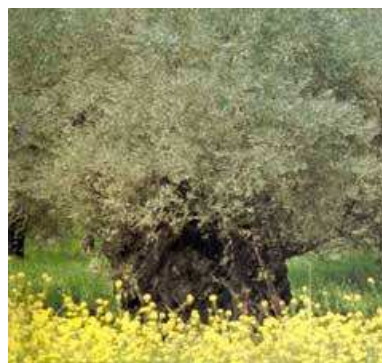
«Δέντρο γεμάτο πατρογονικά παραμύθια, το νοιώθει ο καθένας σαν ευλογία και σαν ασφάλεια (Ι. Μ. Παναγιωτόπουλος)