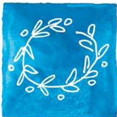
Το έμβλημα των Ολυμπιακών Αγώνων 2004 – Ο Κόρινθος Το κλαδί της ελιάς - ένα Αθηναϊκό, Κλασικό Σύμβολο