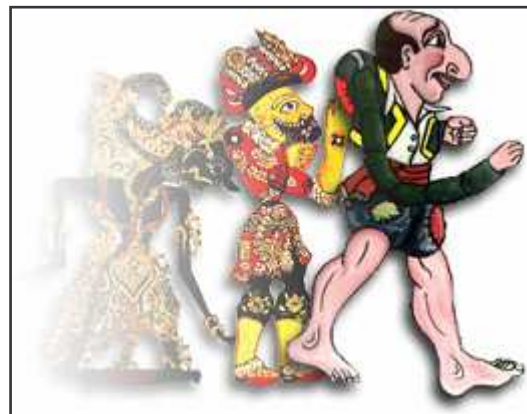
Βέλγικες και Ελληνικές παραδόσεις